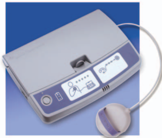
Medtronic CareLink e Antena

Os cuidados de acompanhamento permitem ao seu médico aceder à informação mais recente emitida pelo seu dispositivo para assegurar que o mesmo continua a prestar o melhor tratamento para a condição do seu coração. O acompanhamento à distância utilizando o Serviço da Medtronic CareLink podem contribuir para facilitar a obtenção dos cuidados que necessita. Para algumas pessoas, isto significa menos visitas ao consultório médico e menos tempo perdido deslocando-se de casa para a clínica/consultório e vice-versa – tempo esse que pode ser usado para DESFRUTAR DA VIDA! O envio de informações para a sua clínica/consultório é um processo rápido, conveniente e pode ser efectuado utilizando uma linha de telefone padrão de onde quer que se encontre nos Estados Unidos, Alasca ou Havai.