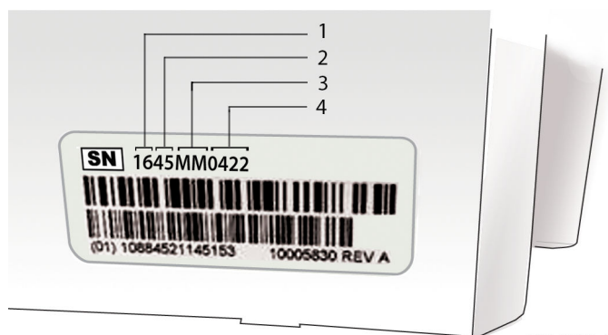
Slika 2. Datum proizvodnje baterije