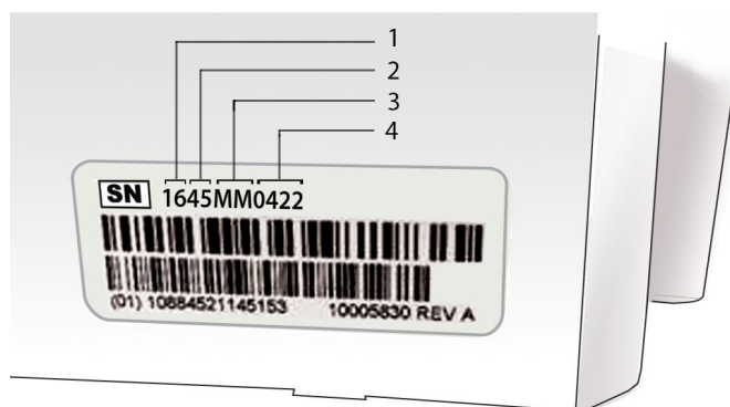
Figur 2. Batteriets tillverkningsdatum