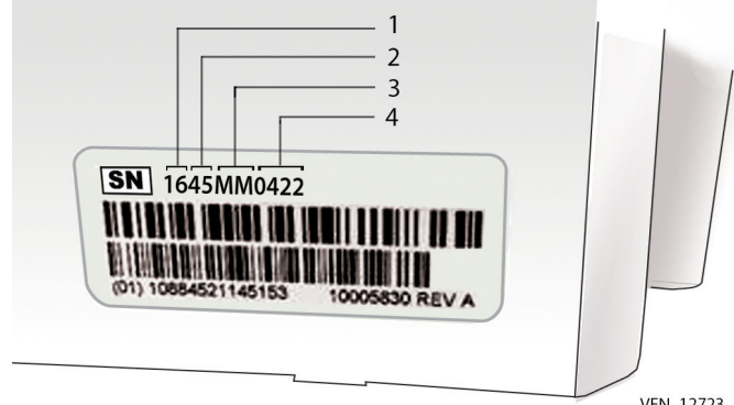
Şekil 2. Batarya üretim tarihi