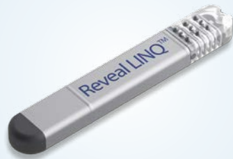
Der Herzmonitor Reveal LINQ in Originalgröße