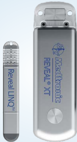
Die Herzmonitore Reveal LINQ und Reveal XT in Originalgröße