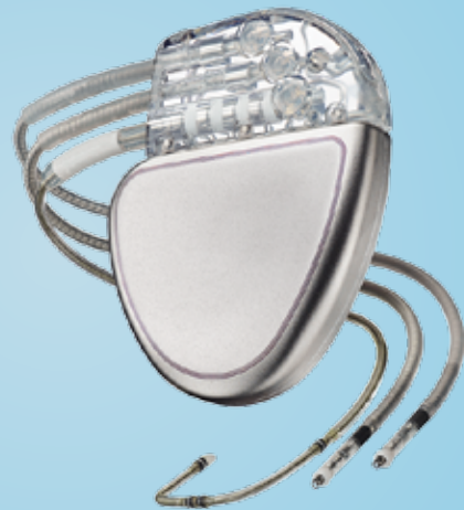
CRT-pacemaker (CRT-P) en geleidingsdraden