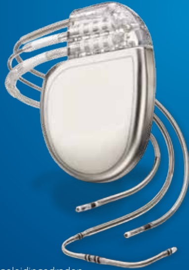
CRT-defibrillator (CRT-D) en geleidingsdraden