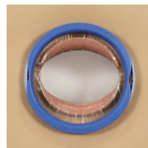
リトラクションリング装着時