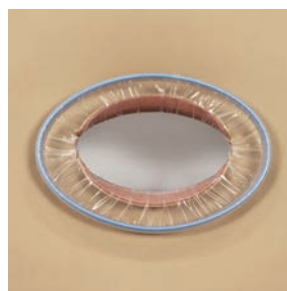
リトラクションリングなし