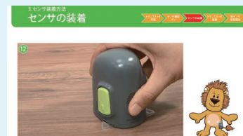
新しい動画・PDFコンテンツ