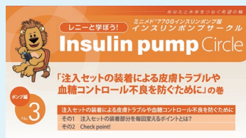
トラブルシューティング動画