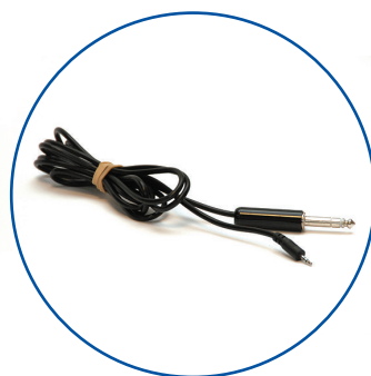
SEA3730 インターリンクケーブル ※Valleylab電気手術器 との連動用

メンテナンス費用のかからないレンタルプログラムで電気手術器/排煙システムの導入をサポートいたします