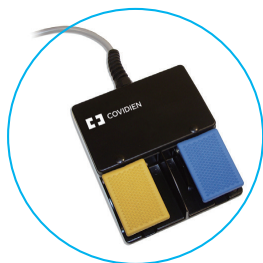
E6008L モノポーラ フットスイッチ