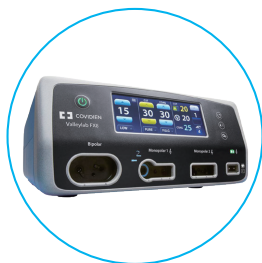
Valleylab™ FX8 エネルギー プラットフォーム