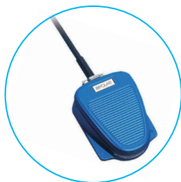
E6009 バイポーラ フットスイッチ