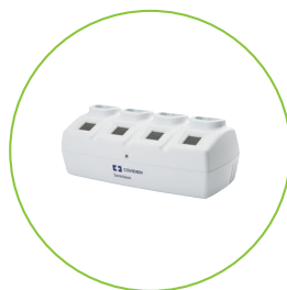
CBCA SONICISION バッテリーチャージャ