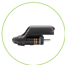
SCGAA SCJ ジェネレータ SCG7AB SONICISION 7 ジェネレーター