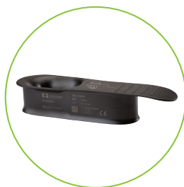
SCBIGA SONICISION インサーションガイド