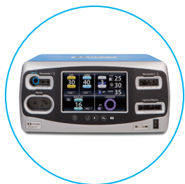
Valleylab™ FT10 エネルギー プラットフォーム