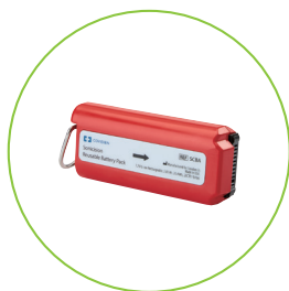
SCBA SONICISION バッテリーパック