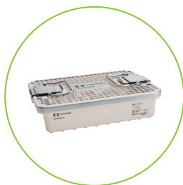
SCSTA SONICISION 滅菌トレイ