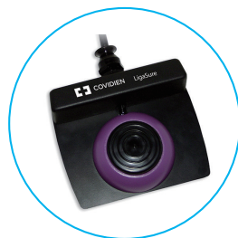
LS0300 LigaSure™ シングル ペダルフットスイッチ