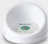
Comunicador de paciente MyCareLink Relay™ (unidad externa)

El MCI LINQ II controla y registra los latidos cardíacos anómalos las 24 horas del día, los 7 días de la semana, de modo que pueda seguir disfrutando de su vida.