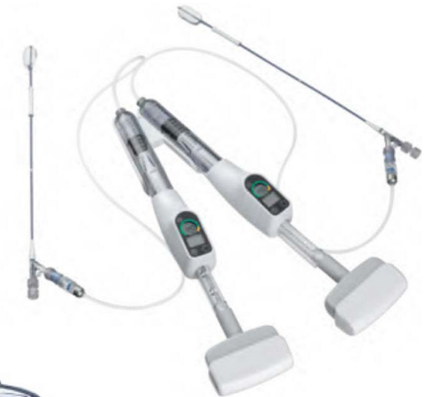
KYPHON® XPANDER™ II