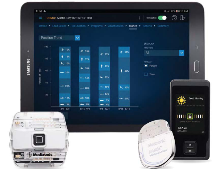
Intellis™ with AdaptiveStim™

Die analogen Bewertungen sind in den jeweiligen Beispielen entsprechend markiert (*).