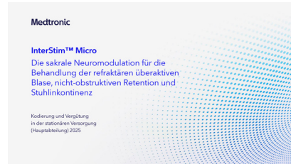
Sakrale Modulation mit InterStim™ Micro