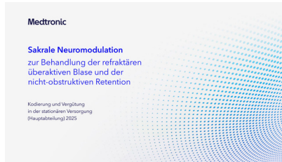
Sakrale Neuromodulation zur Behandlung von Harninkontinenz