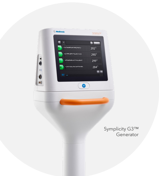
Symlicity G3™ Generator