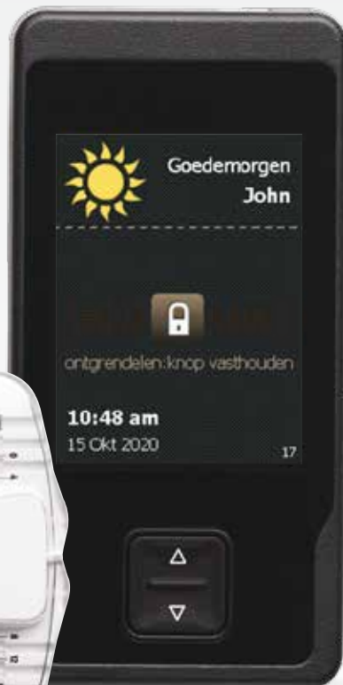
Therapiebeheer met patiëntenprogrammeerapparaat en oplader